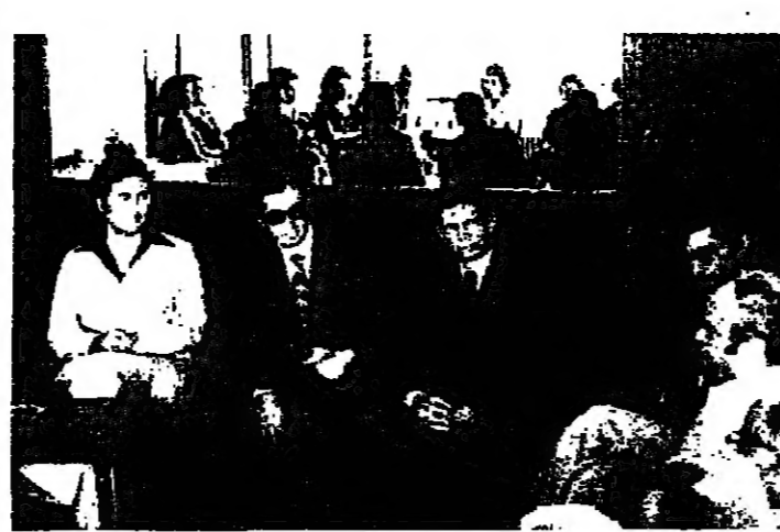
رئيس الجامعة اليسوعية الدكتور زكريا والمعيد تلتقت خلال اجتماعهم في طرابلس

ان مجلس ادارة الجمعية الاستهلاكية اللبنانية الاطرية م . م . زطة ، يدعو جميع الاعضاء السجسية عمومية عادية تمت بتاريخ ٢٠ ايلول الساعة الرابعة والتف في مقرها في حوش النور . وفي حال عدم اكتمال التصاب للمرة الاولى ، ستنفذ الجلسة الثانية في ٥ تشرين الاول في نفس المكان والزمان . مجلس الادارة